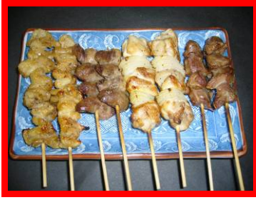
⑥ 焼き鳥盛り合わせ