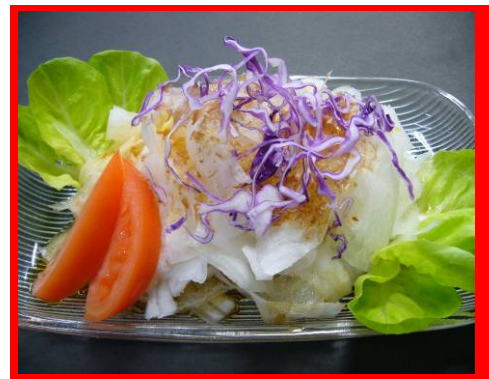
↑ 23 大根サラダ