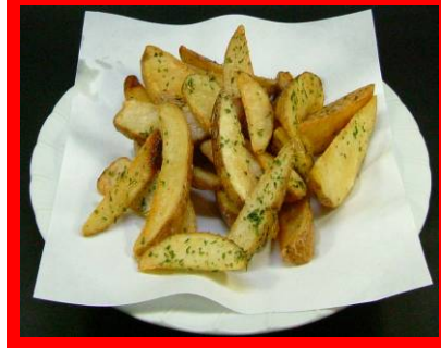
← 9 フライドポテト