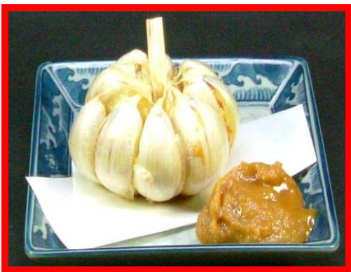
↑ 19 揚げにんにく