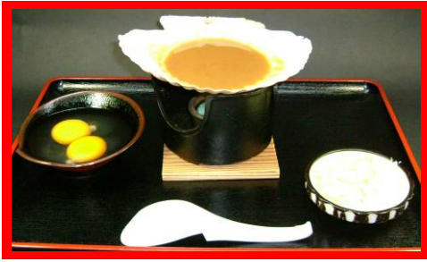
↑ 4 玉子みそ